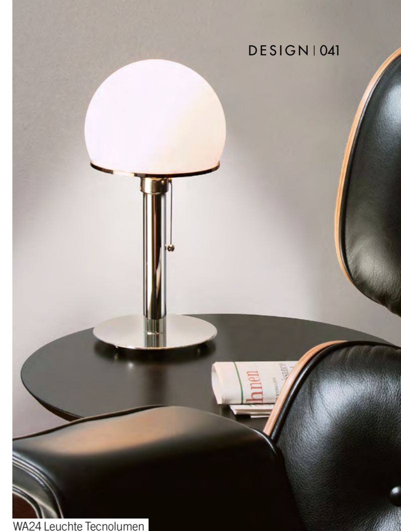
WA24 Leuchte Tecnolumen

Unternehmen Thonet die Freischwinger B 32 und B 64. Die zeitlos schönen Sitzmöbel sind heute wahre Klassiker und haben nichts von ihrer Aktualität verloren. Das künstlerische Urheberrecht am Prinzip des hinterbeinlosen Stuhls erhielt Mart Stam, der mit seinem frühen Entwurf den Weg für diese revolutionäre Erfindung gebahnt hatte. Eine verbesserte Variante, bekannt unter dem Namen S 43, wurde ab 1931 produziert: Mit seiner klaren und zurückhaltenden Form avancierte der Freischwinger schnell zum Erfolg und stattete ab 1933 sogar die Deutsche Nationalbibliothek in Leipzig aus. Inspiriert vom berühmten S 533 F von Mies van der Rohe,