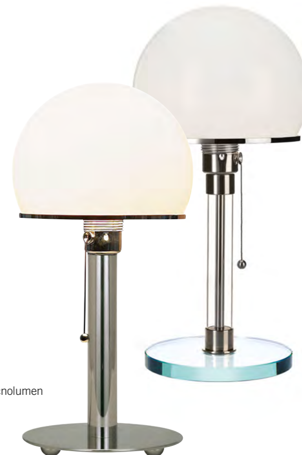
WA24 Leuchte Tecnolumen