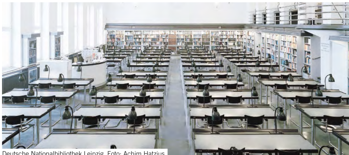
Deutsche Nationalbibliothek Leipzig, Foto: Achim Hatzius