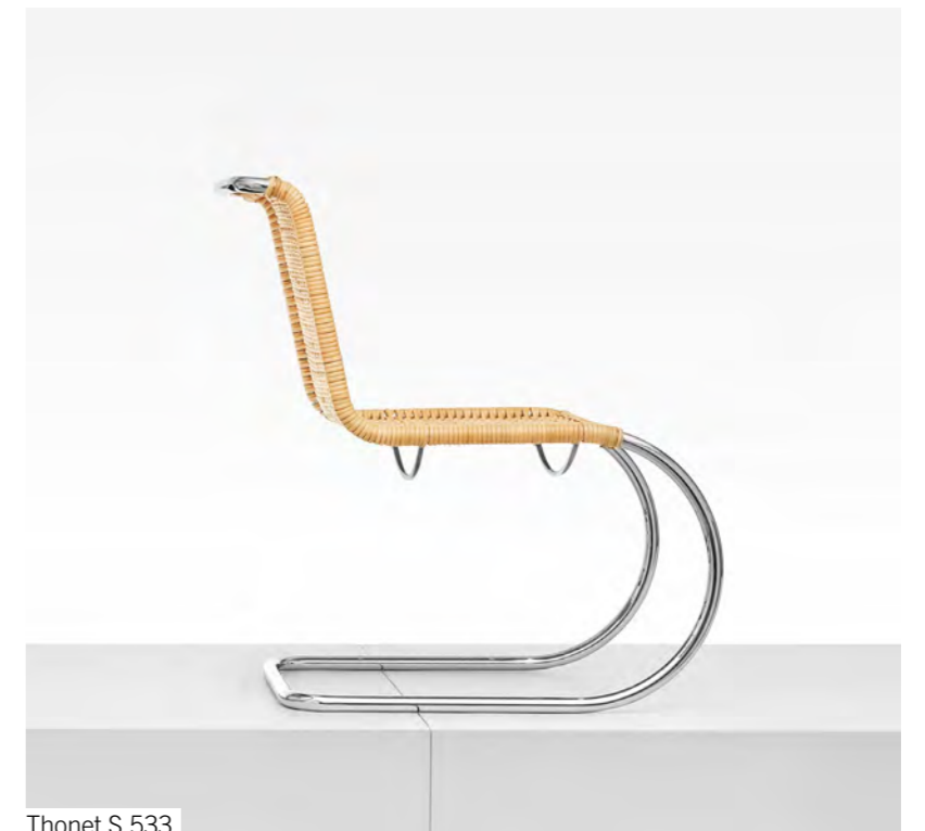
Thonet S 533