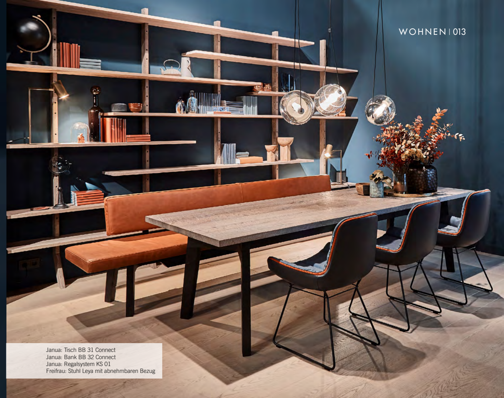
Janua: Tisch BB 31 Connect Janua: Bank BB 32 Connect Janua: Regalsystem KS 01 Freifrau: Stuhl Leya mit abnehmbaren Bezug