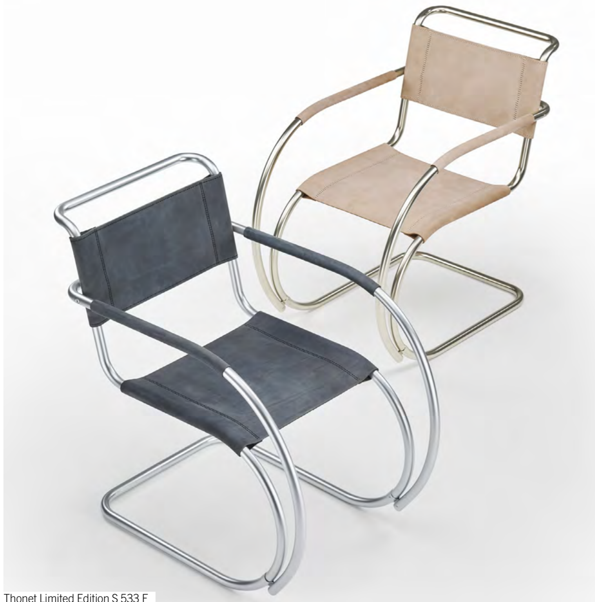
Thonet Limited Edition S 533 F