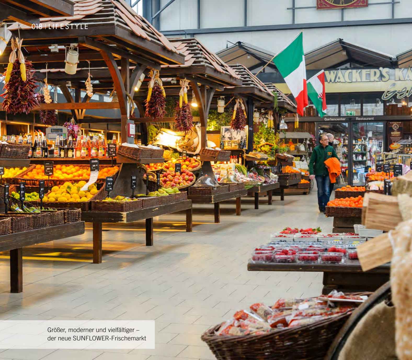
Größer, moderner und vielfältiger – der neue SUNFLOWER-Frischemarkt