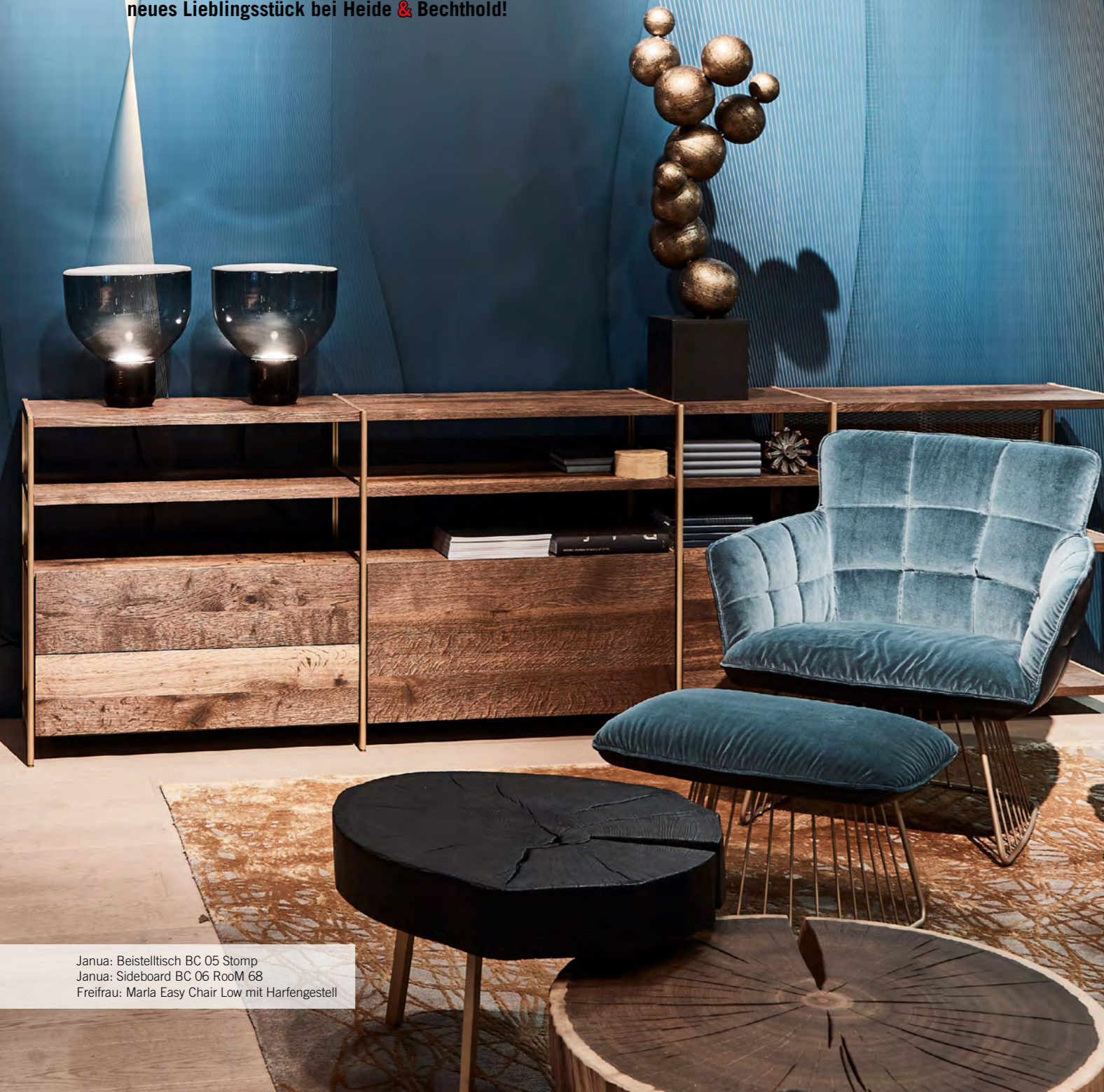
Janua: Beistelltisch BC 05 Stomp Janua: Sideboard BC 06 Room 68 Freifrau: Marla Easy Chair Low mit Harfengestell

Charakteristisches Design, eine besondere Formensprache und handwerkliche Perfektion – hierfür stehen sowohl Janua als auch Freifrau Sitzmöbelmanufaktur. Die Kooperation der beiden Hersteller ist eine Verbindung, die einzigartig in der Möbelbranche ist. Die innovativ gestalteten Möbel beider Unternehmen setzen jeden Raum perfekt in Szene: Wer auf einem Freifrau-Stuhl an einem Tisch von Janua Platz nimmt, spürt die Schönheit zweier Herzschräge im Einklang. Entdecken Sie jetzt Ihr neues Lieblingsstück bei Heide & Bechthold!