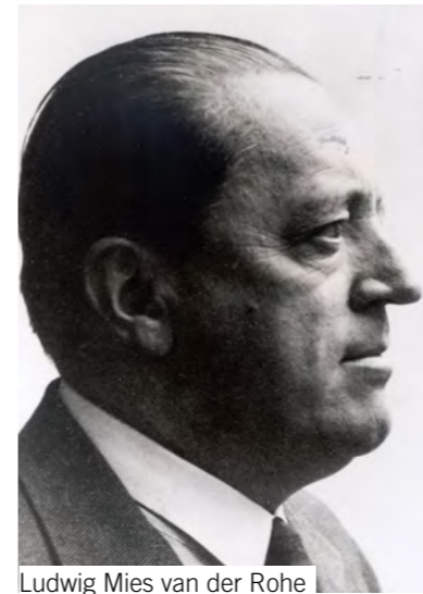
Ludwig Mies van der Rohe

Die praktische Ausrichtung der Schule wurde auch dadurch unterstrichen, dass hier weder Professoren unterrichteten noch Studenten lernten – stattdessen gab es Lehrlinge, Gesellen, Jungmeister sowie Meister. Da das Bauhaus-Manifest die Kunst als nicht lehrbar betrachtet, fand die Ausbildung in Werkstätten statt. Im Jahr 1927 wurde für die Architektur eine eigene Klasse eingeführt, wodurch ihr und der zugehörigen Inneneinrichtung eine größere Bedeutung verliehen wurde.