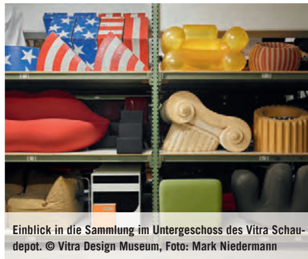
Einblick in die Sammlung im Untergeschoss des Vitra Schaudapot.

modernen Möbeldesigns von 1800 bis heute, darunter frühe Bugholzmöbel, Ikonen der klassischen Moderne von Le Corbusier, Alvar Aalto oder Gerrit Rietveld, aber auch jüngste Entwürfe aus dem 3D-Drucker sowie weniger bekannte oder anonyme Objekte, Prototypen und Versuchsmodelle. Kleinere Wechselausstellungen zu sammlungsbezogenen Themen ergänzen die Präsentation.