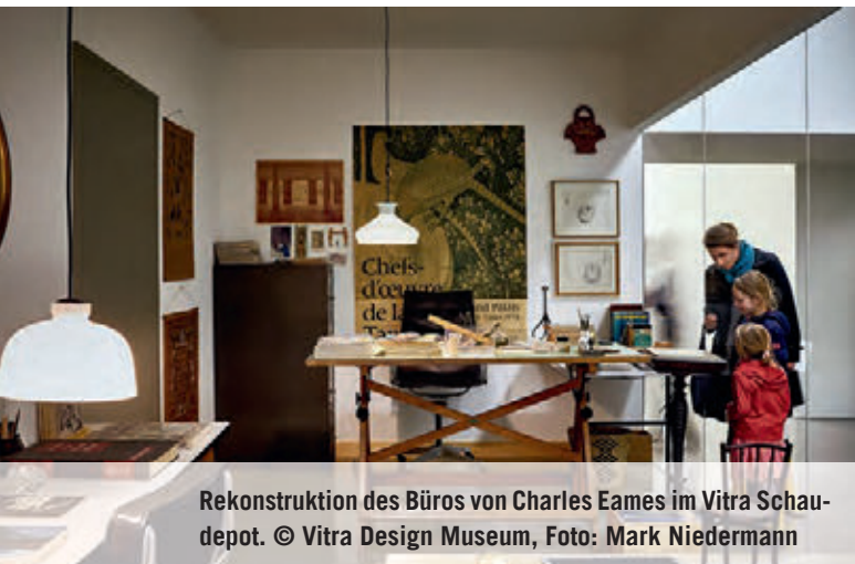
Rekonstruktion des Büros von Charles Eames im Vitra Schaudapot.