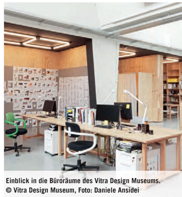
Einblick in die Büroräume des Vitra Design Museums.