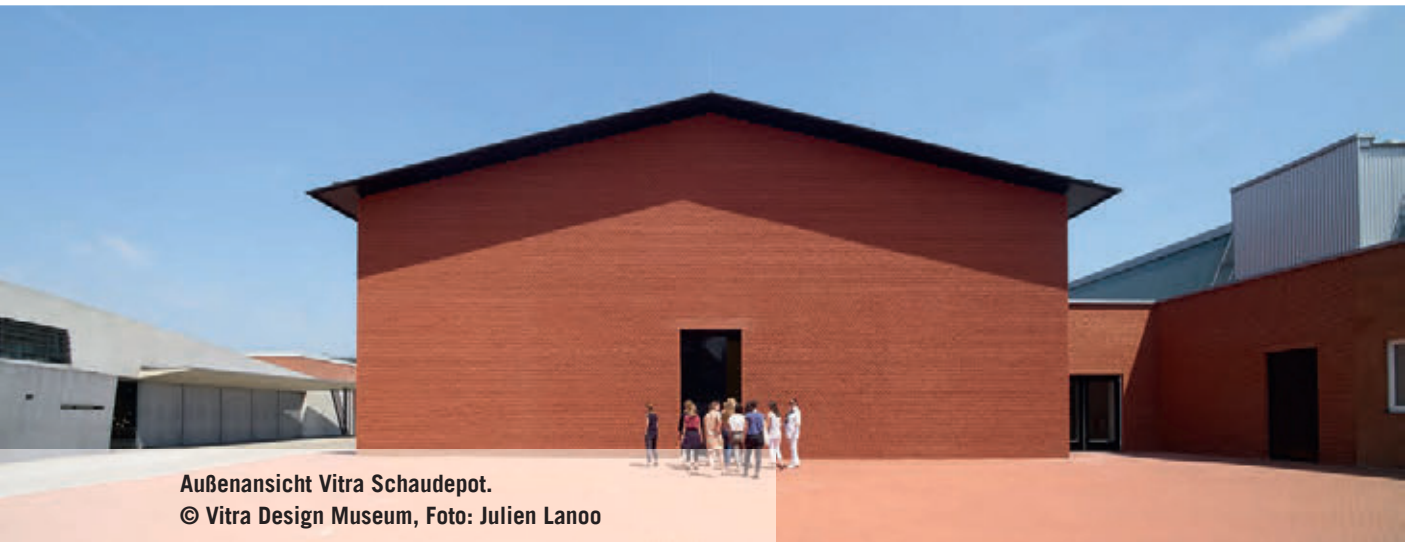
Außenansicht Vitra Schaudapot.