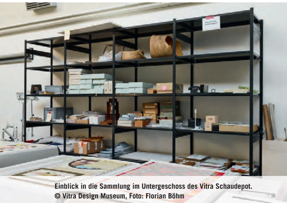
Einblick in die Sammlung im Untergeschoss des Vitra Schaudapot.