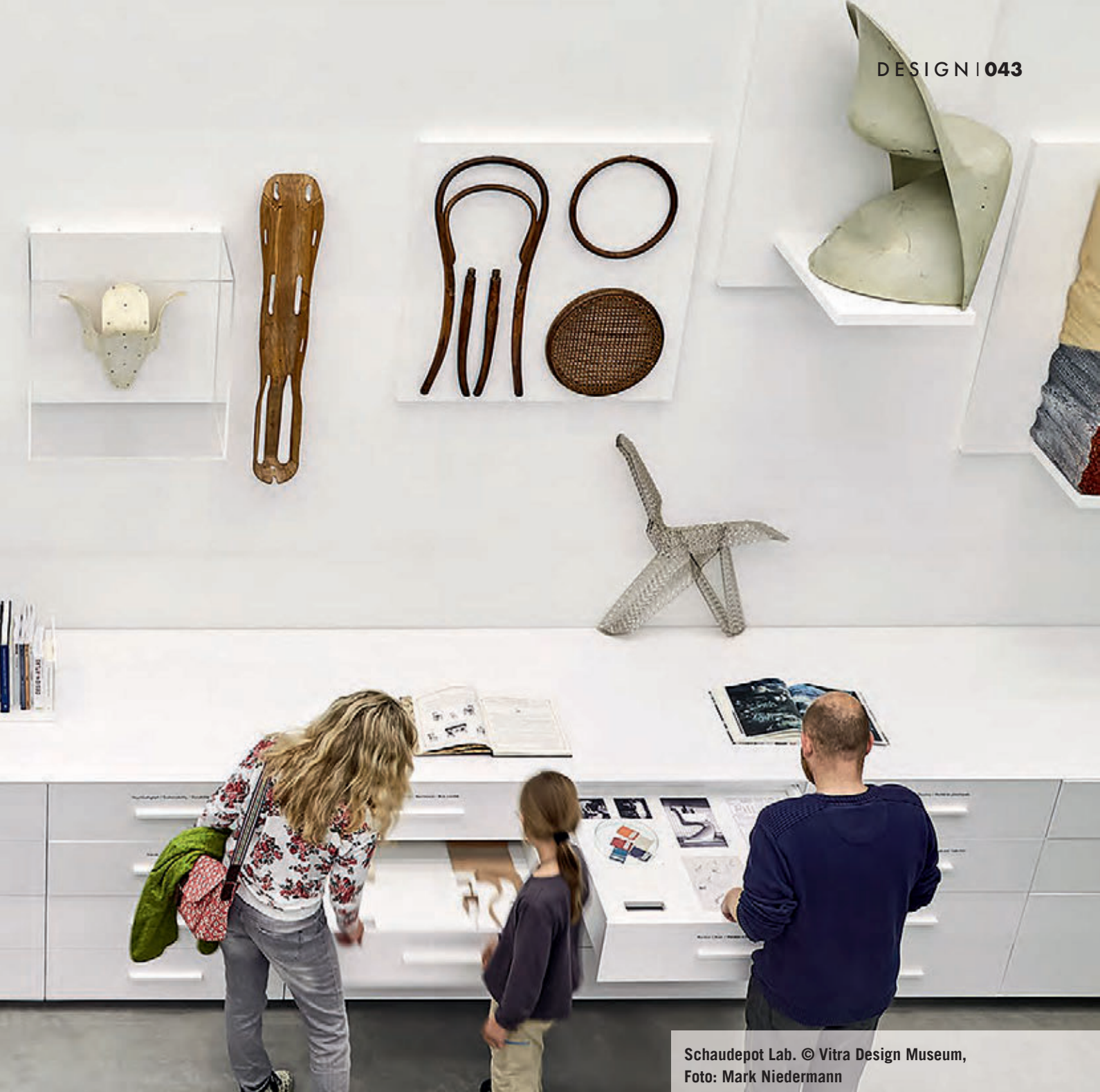
Schaudepot Lab.

Die beeindruckende Sammlung des Vitra Design Museums umfasst rund 20.000 Objekte, darunter etwa 7.000 Möbel, über 1.000 Leuchten, zahlreiche Archive, die Sammlung des Eames Office sowie die Nachlässe von Verner Panton und Alexander Girard. Das Schaudepot entstand mit dem Ziel, die stetig wachsende Sammlung öffentlich zugänglich zu machen. Denn obwohl das Hauptgebäude des Museums von Frank Gehry ursprünglich als Sammlungsbau konzipiert war, präsentiert das Museum darin heute große Wechselausstellungen. Den Grundstein für die Sammlung legte der Museumsgründer Rolf Fehlbaum. Er hatte in den 1980er Jahren eine Möbelsammlung aufgebaut, die er dem Vitra Design Museum bei seiner Grün-